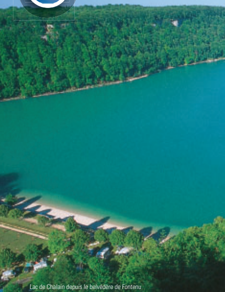
Lac de Chalain depuis la belvédère de Fontenu